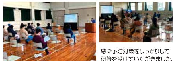
感染予防対策をしっかりとて研しゅうを受けていただきました。

子ども会の行事が安全に楽しめるよう、新役員のみなさんに集まっていただき研しゅうをしました。今年一年よろしくお祈いします!