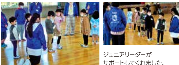
ジュニアリーダーがサポートしてくれました。

安じょう中部地区の新一年生のみんなが、子ども会のレクリエーションを体験しました。伝言ゲームやあと出しジャンケンを楽しめました!