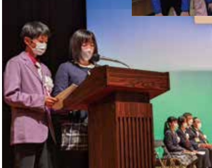
ステキな司会でした!