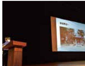
赤松子ども会の発表