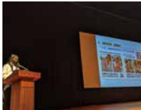
みよし・ひまわり 子ども会の発表