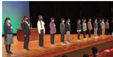
表彰おめでとございます!