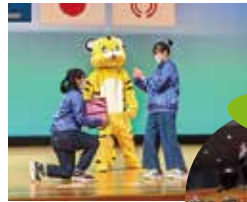
豪華商品の ビンゴ大会