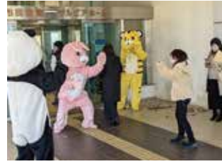
ジュニアリー ダー 大活躍!